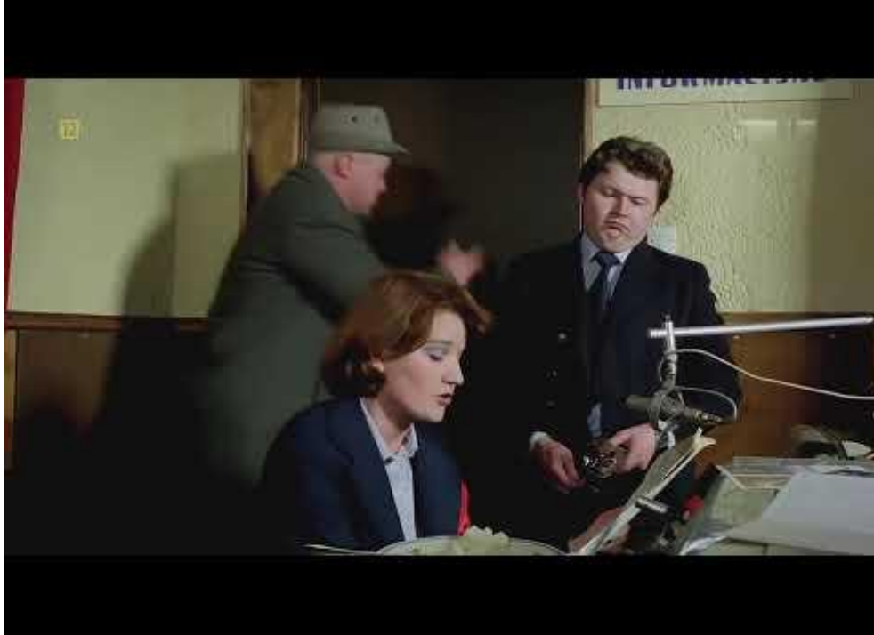
Miś , reż. S. Bareja, Polska 1980,

YouTube, link: https://www.youtube.com/watch?v=A7wZkY9jQ8M [Dostęp: 25.02.2022]